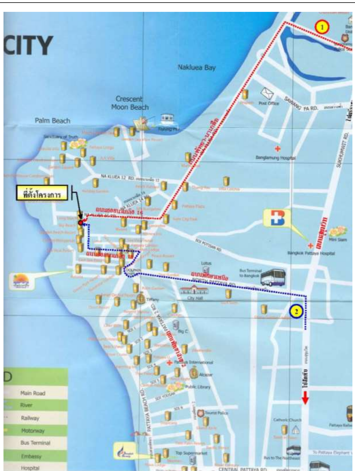
รูปที่ 1-1 แสดงที่ตั้งโครงการ